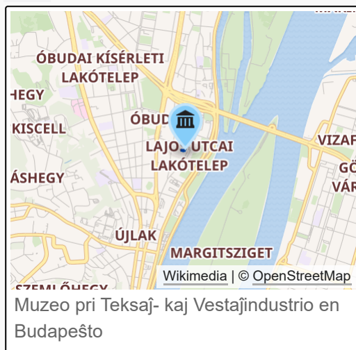
Muzeo pri Teksaĵ- kaj Vestajindustrio en Budapeŝto

Parto de Óbuda Museum vd Retpaĝo http://www.textilmuzeum.hu/