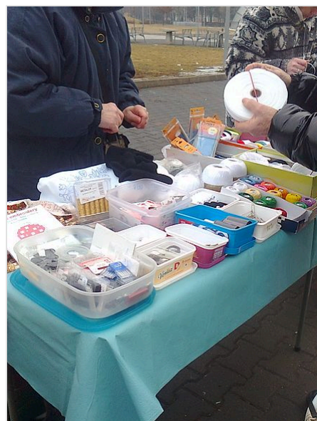
Tablo de mercervarvendisto en foirejo