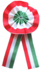
Hungara kokardo el rubando kun koloraj strioj