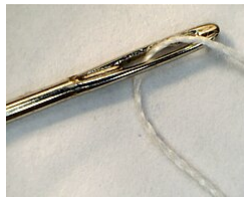
Kudrilo kun entredigita fadeno