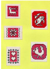
Antaŭprintitaj ŝtofpecoj por manbrodado