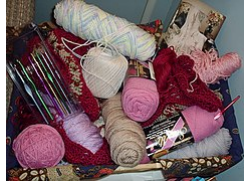
Fadenoj pro manlaboro kaj kroĉetiloj