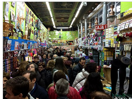
Merceraĵsekcio en granda magazeno